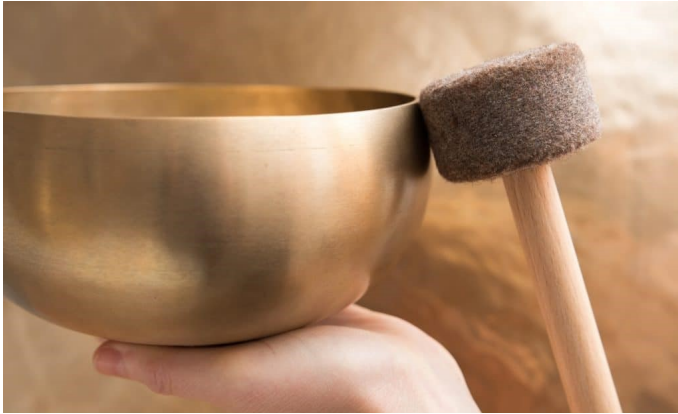
Klangschalenthérapie – Ablauf und Wirkung – Heilpraxis (heilpraxisnet.de)

Zu viel Stress und Anspannung machen krank. In diesem Kurs lernen Sie, sich zu entspannen. Sie liegen gemütlich auf dicken Matten. Und lauschen den Klängen der Klangschalen.