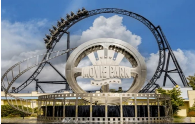
Filmpark Bottrop-Kirchhellen, Deutschland. 3. August 2023.

Heute geht es auf eine wilde Fahrt in den Movie Park. Es erwarten Sie viele aufregende Achterbahnen, jede Menge Spannung und Spaß für jedermann.