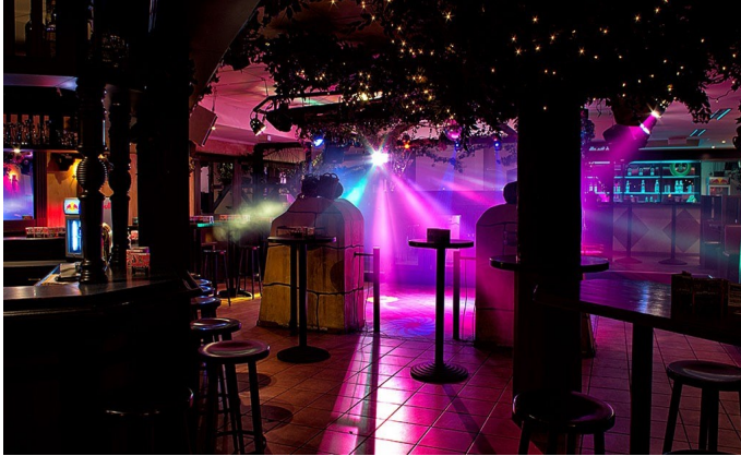
About us - Abacco - Ihr exklusives Tanzlokal in Nordhorn ( tanzlokal-abacco.de ); 2.11.2023